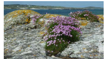
Blumen in einem Felsspalt in Irland

Ja, es gibt sie, diese schönen Momente ... und ich muss bewusst hinschauen und wahrnehmen. Und wenn mir das gut gelingt, dann ist es eine wundervolle Geste, dieses Geschenk weiter zu geben und mir zu überlegen,