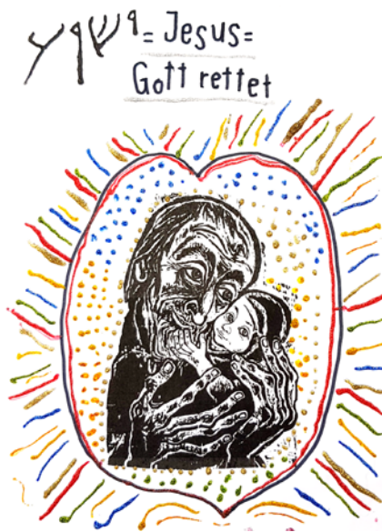
Enkel und Großvater gestalten gemeinsam das Bild von Walter Habdank „Simeons Augen haben den Heiland gesehen“ – 1. Klasse