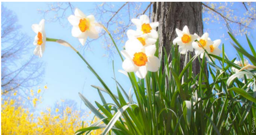
Die Sonne scheint auf zum Osterfest aufblühende Narzissen: Hoffen, leben, lieben!

Was wird noch kommen? Das war die Eingangsfrage – und zu Ostern haben wir eine Antwort: Gott ist stärker als alle Macht dieser Welt, Gott ist stärker als der Tod – aber es geht wohl nicht ohne uns!