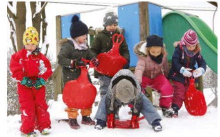
Das Kindergarten team

Der Hügel konnte im heurigen Winter oft zum Herunterrutschen genutzt werden.