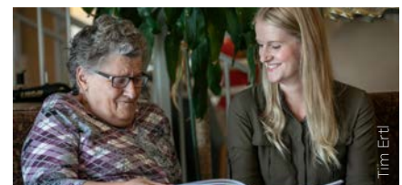
Besuchsdienst im Caritas Pflegewohnhaus Lannach