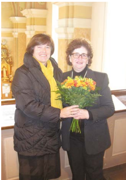
Einige Erinnerungen an das gemeinsame Singen und Wirken.