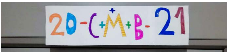
Ein Drittklässler gestaltet den Segensspruch der Sternsinger für Zuhause.