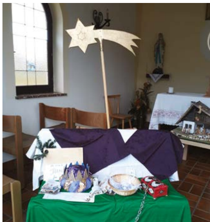
Fotos von den Stationen in Dietersdorf, Forst, Gradenfeld, Kasten, Werndorf, Wundschuh und Zwaring. Leider gibt es kein Bild aus Ponigl und Steindorf.

Wir danken allen, die die Möglichkeit, in einer der Dorfkapellen, bei der Postpartnerstelle Werndorf oder in der Pfarrkirche, ihre Spende abzugeben, nützten.