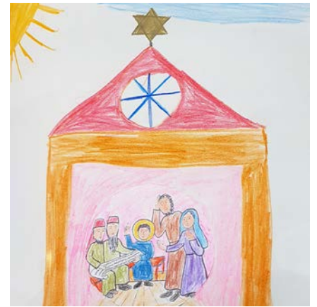
So stellt sich eine Erstklasslerin den Tempel zur Zeit Jesu vor.

Immer wieder bekam ich schöne Rückmeldungen von Kindern und El-