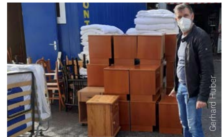
Anlieferung der Möbel durch die Caritas Graz

fonaten aber auch in einem Artikel in Večernji list, einer der größten kroatischen Zeitungen, dokumentiert.