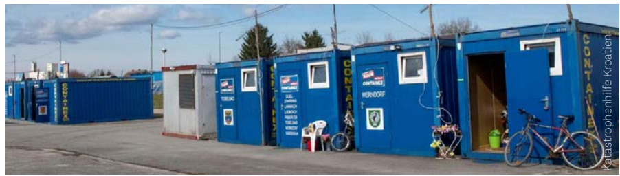
Container-Lager in Sisak